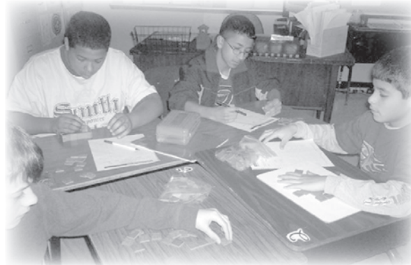
For more upcoming events, visit www.smcisd.net